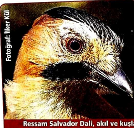
Ressam Salvador Dalı, akıl ve kuşlarla ilgili "İçinde hırs barındırmayan bir akıl, kanatsız kuş gibidir" demiş.