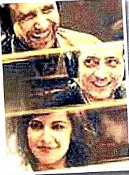
dışı, eğlenceli, hüzünlü, gerçek...

Oğleden sonra filmi izlemeye tek başıma gittim. Perdede "Ekip film tedirginlikle sunar" cümlesini gördüğüm anda anlamıştım, sıra dışı bir film izleyecektim. İzledim de... Sıra