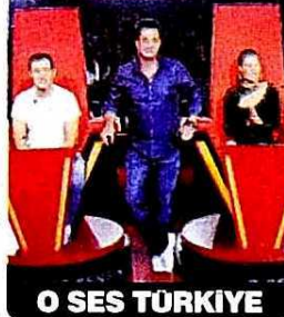
O SES TÜRKİYE

► SUNUCU-LUĞUNU Acun Ilıcalı'nın üstlendiği yarışma "The Voice"nin Türkiye versiyonu "O Ses Türkiye"de jüri adayları arkası dönük olarak dinliyor. Sesi beğendiği takdirde koltuğunu çevirip adayla yüz yüze geldiği yarışmada en önemli amaç sesin dış görünüşün gölgesinde kalmaması. SHOW/20.00