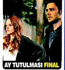
AY TUTULMASI FINAL

► ŞEBNEM , Ayla'nın babasının aldattığından emindir. Bunu kanıtlamaya kararlıdır. Doktor İsmet'in peşini bırakmayan Leyla, sonunda öldü zannettiği kızının Şebnem olduğunu öğrenir. İkinci kez büyük bir şok yaşayan Leyla acı gerçek karşısında ne yapacağını bilemez. STAR/20.00